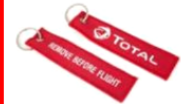
Porte clé tissu double face